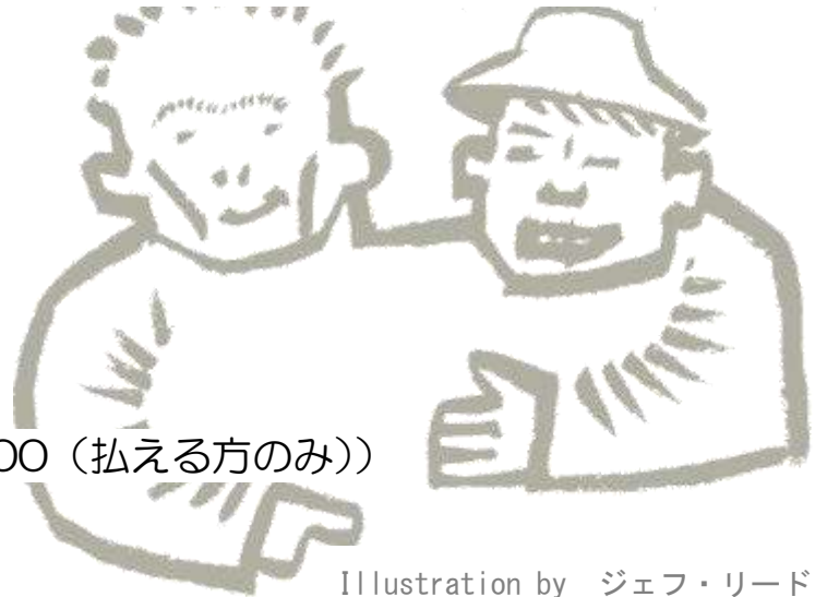
Illustration by ジェフ・リード